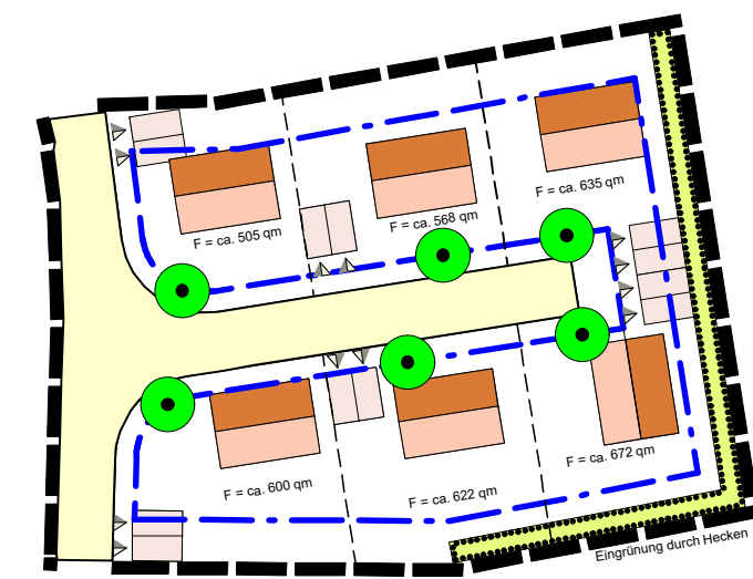
Städtebaul. Entwurf (unverbindlich)

H = maximale Gebäudehöhe in Meter über N.N.