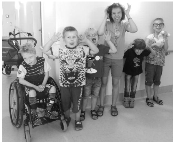
Die verschiedenen Angebote im Rahmen des diesjährigen Ferienprogramms haben den Kindern viel Freude bereitet.

Werbung im Amtsblatt – informativ und preiswert Anzeigenschluss Dienstag 15.00 Uhr