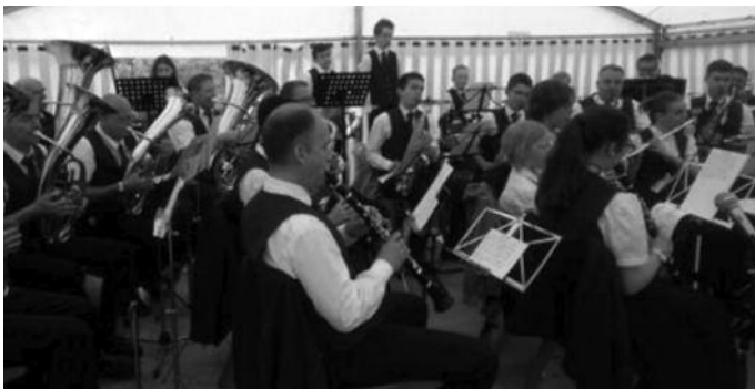
Die Stadtkapelle am Vatertag beim Neckarfest in Lustnau.

Wir proben diese Woche am Freitag, 22. Mai 2015, um 20.00 Uhr. Am Vatertag fuhr die Stadtkapelle mit dem Bus nach Tübingen-Lustnau, um das dortige Neckarfest des dortigen Musikvereins musikalisch zu umrahmen. Die Stadtkapelle hat ein sehr abwechslungsreiches Programm präsentiert. Die Bierbänke im Zelt füllten sich schnell. Nach dem Auftritt der Stadtkapelle, der um 14.30 Uhr mit einer Zugabe endete, verweilten die Musiker und Musikerinnen noch eine kurze Zeit in Lustnau bis der Bus wieder nach Gammertingen fuhr. Dort angekommen wurde noch ein kleines Grillfest als Ersatz für die ins Wasser gefallene Maiwanderung abgehalten.