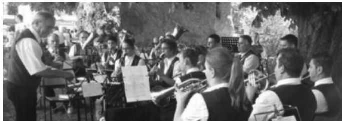
An Fronleichnam durfte die Stadtkapelle den Gottesdienst musikalisch umrahmen und im Anschluss die Kirchenbesucher beim Pfarrfest unterhalten.

Am Sonntag, 14. Juni 2015, nehmen wir beim Kreismusikfest in Ostrach teil. Abfahrt mit dem Bus ist um 10.30 Uhr in der Marktstraße. Für den Gesamtchor benötigen wir die Stücke "Deutschlandlied", "Furchtlos und Treu", "Highland Cathedral" und "ADL-Marsch" sowie für den Umzug die oben genannten Märsche. Die Rückfahrt ist um 17.00 Uhr.