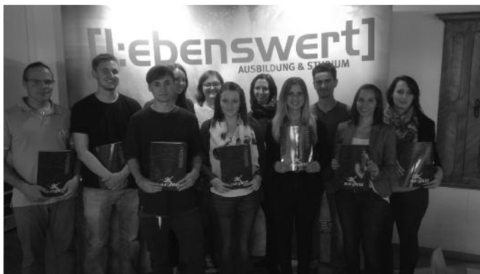
Die Auszubildenden von Marienberg und der Bruderhausdiakonie erhalten ihre Zertifikate „Europass-Mobilität“ für ein dreiwöchiges Auslandspraktikum im Rahmen ihrer Ausbildung.