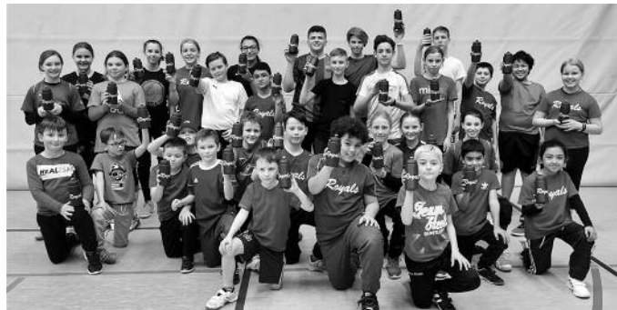
Das Bild zeigt die Schüler, die U12-Mädchen und die Jugend.