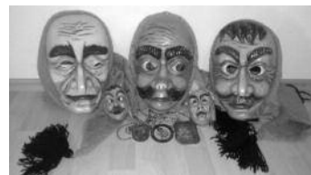
Unsere drei Masken.