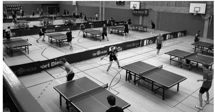
„Volles Haus bei den diesjährigen Stadtmeisterschaften“

Ein Hauptgrund dafür ist wiederum eine tolle und durchdachte Organisation des Turniers, welche uns gegenüber anderen Veranstaltungen einzigartig macht. Den Spielern selbst wird mehr Verantwortung übertragen, was dem Ganzen eine riesige Zeitersparnis bringt. So gingen auch dieses Mal die meisten zufriedenen nach Hause und werden hoffentlich nächstes Jahr wieder kommen.