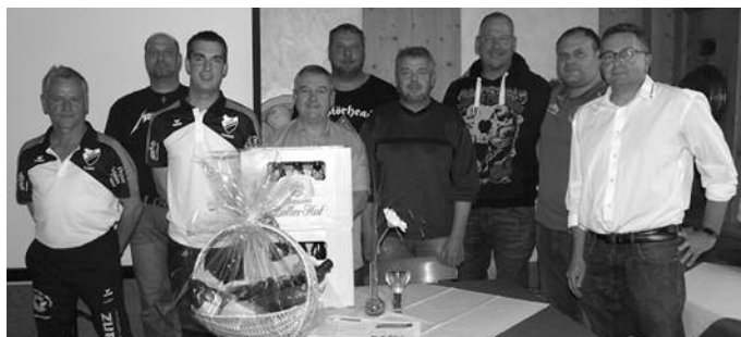
Als Dank gab's ein kleines Geschenk für das Greenkeeper-Team