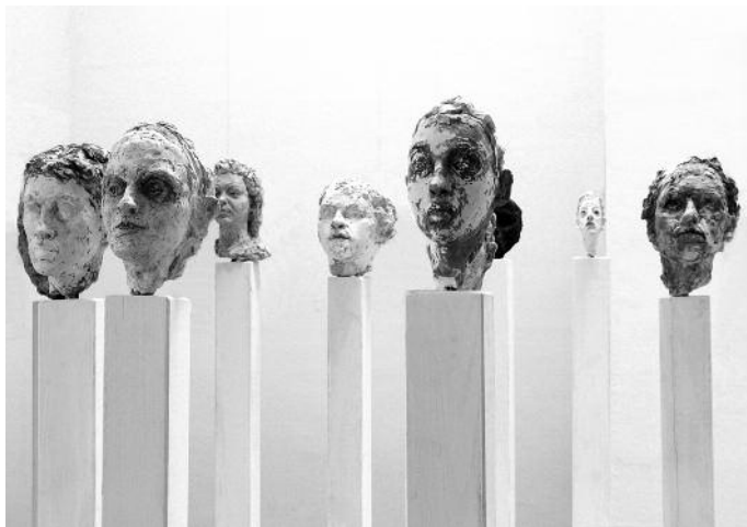
Ralf Ehmman „Köpfe“

Die Ausstellung ist im Klostergebäude Mariaberg bis einschließlich Sonntag, 10. September 2017, montags bis donnerstags von 8.00 bis 17.00 Uhr sowie freitags von 8.00 bis 15.00 Uhr zu besichtigen. Ab Mai sind das Kloster und die Klosterkirche auch sonntags von 13.30 – 16.30 Uhr zu besichtigen.