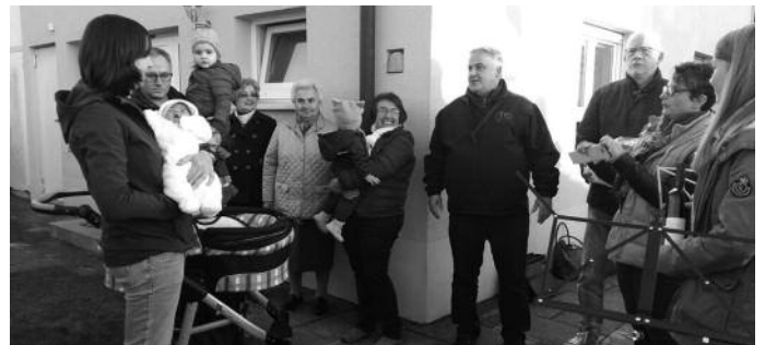
Das jüngste Stadtkapellenmitglied

Voranzeige: Bitte Termin vormerken. Am 05. Januar 2017 findet in der Aula des Gammertinger Gymnasiums das Dreikönigskonzert der Stadtkapelle Gammertingen statt. Dirigent Huntgeburth hat ein tolles Programm vorbereitet. Unsere Vorgruppe und Jugendkapelle der Stadt Gammertingen mit Neufra wollen ebenfalls Ihr Können unter Beweis stellen. Die Stadtkapelle Gammertingen lädt bereits heute ganz herzlich dazu ein. Gerne können Eintrittskarten bei einem der Vorstände als Weihnachtsgeschenk erstanden werden.