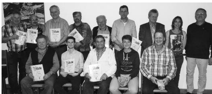
Der SV Bronnen ehrt eine stattliche Anzahl an Mitgliedern, die ihre Auszeichnung persönlich entgegennehmen, sowie einige Vorstandsmitglieder des Sportvereins Bronnen.